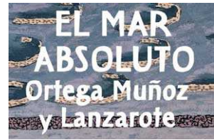
Ortega Muñoz Tenerife, 1971 Óleo/lienzo 73 x 92 cm