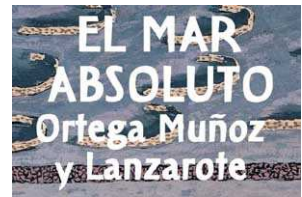
Ortega Muñoz Lanzarote. Paredes, 1969 Óleo/lienzo 73 x 92 cm